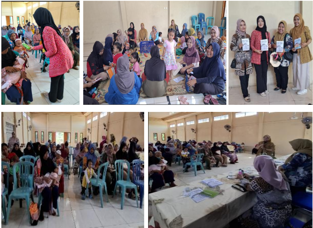
Gambar 2. Kegiatan Pengabdian Masyarakat

dan menjadi salah satu strategi preventif untuk mengurangi kesalahan penggunaan obat di rumah. Berbagai penelitian menunjukkan bahwa peningkatan pengetahuan orang tua berhubungan dengan rasionalitas swamedikasi dan penurunan tindakan yang berisiko pada anak. Dengan demikian, intervensi edukasi seperti yang dilakukan di Desa Kleco berpotensi memberikan kontribusi nyata dalam upaya menurunkan morbiditas dan mortalitas pada kelompok usia balita, terutama bila diikuti dengan penguatan kegiatan lanjutan di tingkat komunitas.