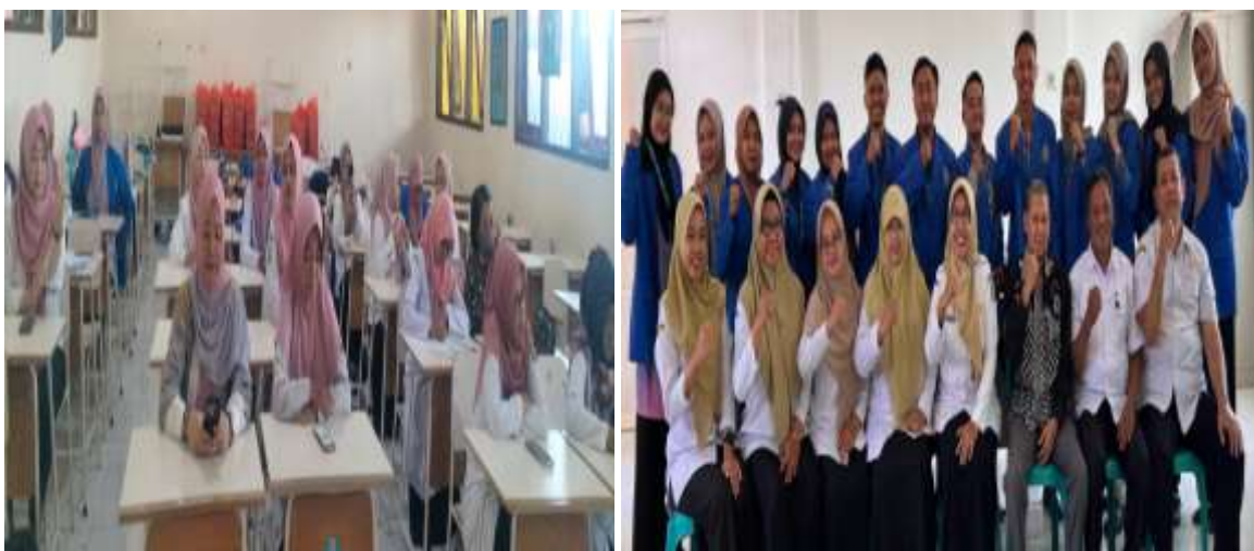
Gambar 4. Dokumentasi Hasil Kegiatan

Secara keseluruhan, pelatihan menunjukkan peningkatan partisipasi aktif, pemahaman konseptual, dan keterampilan guru dalam memanfaatkan AI pada proses pembelajaran. Guru mulai memandang AI sebagai mitra strategis dalam mendukung inovasi dan efisiensi pedagogis, bukan sebagai ancaman terhadap profesi guru. Temuan ini memperkuat bahwa pelatihan berbasis praktik dan kolaboratif efektif dalam meningkatkan kompetensi digital sekaligus kepercayaan diri guru dalam mengintegrasikan AI secara bertanggung jawab dalam pembelajaran (Nazaretsky et al., 2022; Uzumcu & Acilmis, 2024).