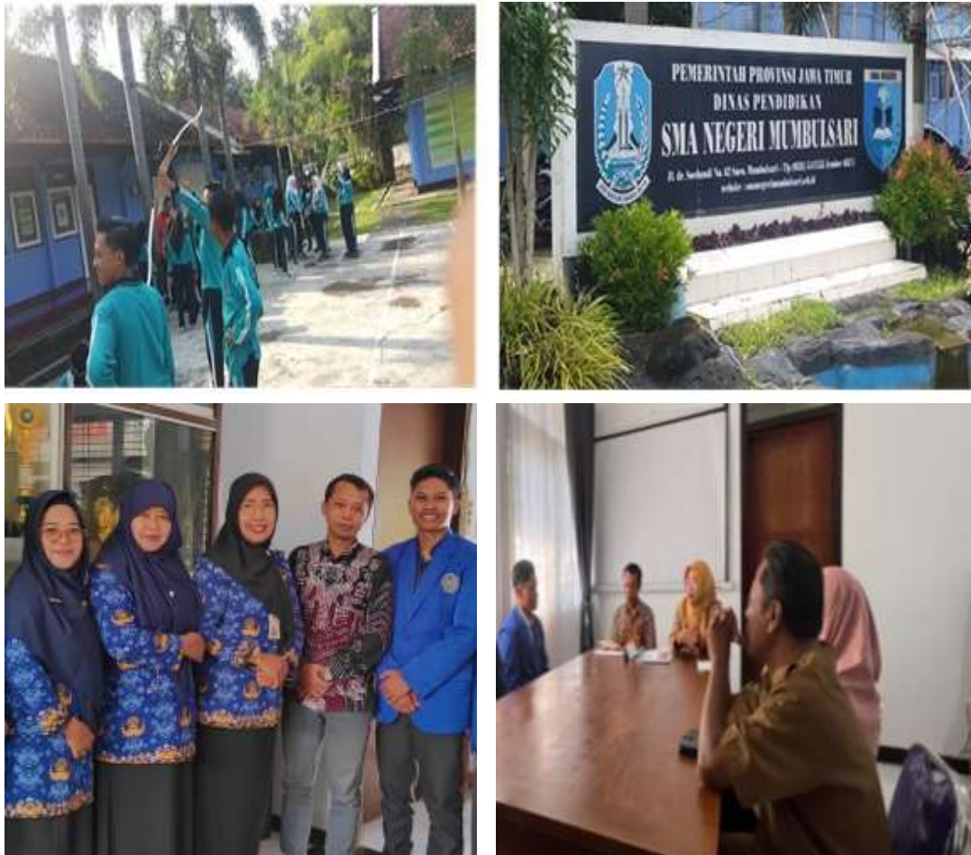
Gambar 2. Tahap Persiapan dan Koordinasi

dilengkapi instrumen asesmen awal untuk memetakan kesiapan guru dari aspek pengetahuan, pengalaman, dan sikap. Kesiapan awal ini penting karena keberhasilan adopsi teknologi sangat dipengaruhi oleh tingkat kepercayaan dan kesiapan pengguna (Nazaretsky et al., 2022; Kim et al., 2022). Selanjutnya, dilakukan koordinasi teknis dengan pihak sekolah terkait jadwal, peserta, serta fasilitas pendukung guna memastikan pelaksanaan berjalan sistematis dan kontekstual.