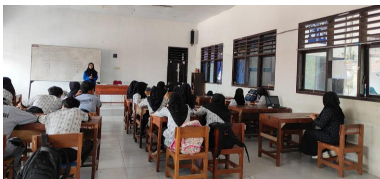
Gambar 3. Kegiatan Penerapan Model Pembelajaran PjBL

Pada minggu ketiga hingga awal minggu keempat, guru mulai menerapkan metode PjBL di kelas masing-masing dengan didampingi oleh tim pengabdian. Siswa dilibatkan dalam proyek literasi seperti membaca kritis, penulisan esai argumentatif, dan penyusunan laporan berbasis data. Kegiatan ini dirancang untuk mendorong siswa berpikir kritis, kreatif, dan aktif dalam pembelajaran. Tim pengabdian memberikan pendampingan kepada guru untuk memastikan kelancaran pelaksanaan dan memberikan masukan jika diperlukan.