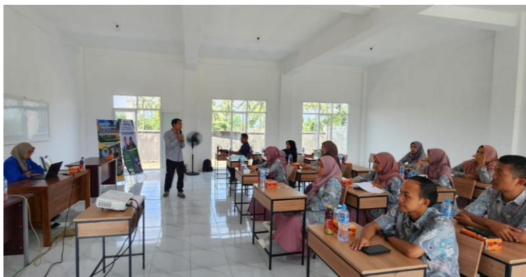
Gambar 2. Kegiatan Penyampaian Materi

Pada minggu kedua, dilakukan pelatihan intensif kepada para guru mengenai konsep dan implementasi PjBL. Pelatihan ini mencakup strategi literasi membaca dan menulis serta panduan pengintegrasian PjBL dalam pembelajaran sehari-hari. Modul literasi berbasis proyek yang dirancang oleh tim pengabdian juga diperkenalkan kepada guru sebagai panduan praktis. Selama pelatihan, guru-guru diajak untuk merancang rencana pembelajaran berbasis PjBL yang relevan dengan kebutuhan siswa mereka.