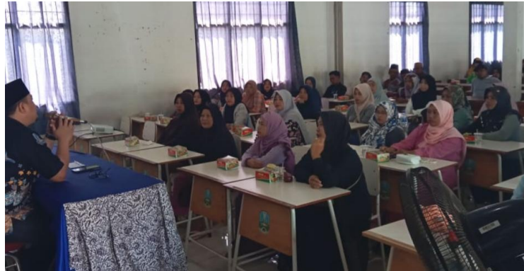
Gambar 4. Kegiatan Evaluasi Kegiatan

kompetensi guru. Pre-test dan post-test diberikan kepada siswa untuk melihat peningkatan kemampuan mereka dalam membaca dan menulis. Proyek literasi siswa, seperti esai dan laporan, juga dinilai untuk mengukur kualitas pembelajaran. Selain itu, survei kepuasan dilakukan untuk mengetahui respons siswa dan guru terhadap program. Refleksi bersama antara tim pengabdian, guru, dan siswa dilaksanakan untuk membahas keberhasilan program sekaligus merumuskan rencana keberlanjutan.