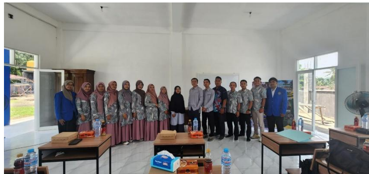
Gambar 2. Pembukaan Acara Kegiatan Pengabdian Kepada Masyarakat Tahap Persiapan dan Analisis Kebutuhan (13-17 Januari 2025)

Program pengabdian masyarakat yang dilaksanakan di SMK Muhammadiyah 4 Kalisat Jember berlangsung selama satu bulan, dimulai pada Senin, 13 Januari 2025, hingga Jumat, 28 Februari 2025. Program ini bertujuan untuk meningkatkan literasi membaca dan menulis siswa serta kompetensi guru dalam menerapkan pembelajaran inovatif berbasis proyek ( Project-Based Learning/PjBL ). Rangkaian kegiatan dirancang secara sistematis, mulai dari pelatihan guru, implementasi di kelas, hingga evaluasi keberhasilan program.