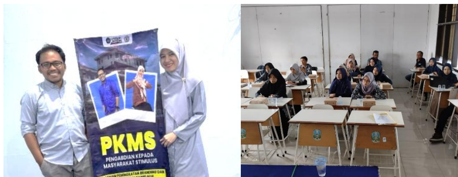
Gambar 2. Proses Pelatihan di SMK Muhammadiyah Kalisat

Peserta diperkenalkan pada konsep manajemen media sosial yang efektif, termasuk strategi penjadwalan konten, analisis performa postingan, serta penggunaan data analitik untuk mengukur keberhasilan promosi.