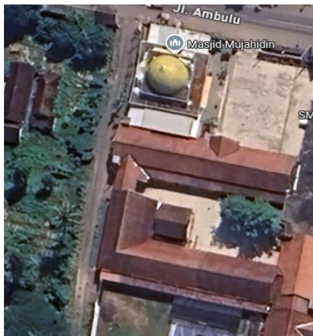
Gambar 1. Lokasi Pengabdian Masyarakat

kebutuhan nyata pengguna, sehingga solusi yang dirancang menjadi lebih tepat sasaran dan aplikatif.