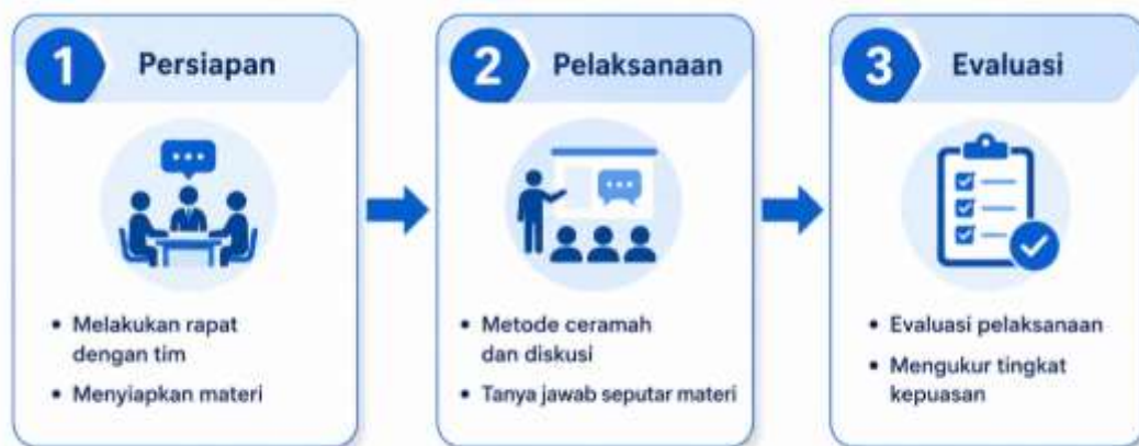
Gambar 2. Metode Pelaksanaan Kegiatan

Metode yang digunakan dalam kegiatan pengabdian kepada masyarakat menggunakan pendekatan Participatory Action Research (PAR), yaitu metode yang melibatkan partisipasi aktif antara tim pengabdian, pelatih, orang tua, dan para pesilat selama proses kegiatan berlangsung (Ansori, 2024). Melalui metode ini, seluruh pihak dapat berperan dalam mengidentifikasi permasalahan, melaksanakan program pembinaan, hingga melakukan evaluasi hasil kegiatan secara bersama-sama.