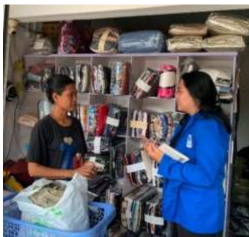
UMKM Cleansy laundry

Dalam aspek promosi media sosial, hasil yang dicapai pada Cleansy Laundry dan Sinar Laundry menunjukkan dampak yang sangat positif. Kedua mitra berhasil memiliki akun Instagram yang digunakan secara spesifik untuk keperluan promosi usaha (Hartono & Supriatman, 2024). Pemilik dan karyawan memiliki kemampuan untuk menghasilkan konten promosi yang mencakup foto produk dengan kualitas visual yang baik, penyusunan caption yang informatif dan menarik, serta melaksanakan pengunggahan konten secara rutin dan terprogram. Hasil tersebut sesuai dengan penelitian (Sholahuddin et al., 2024) yang menunjukkan terjadinya peningkatan jumlah pengikut serta kenaikan pendapatan yang cukup besar setelah mengikuti pelatihan media sosial. Hal tersebut berdampak pada meningkatnya interaksi antara pelaku usaha dan pelanggan serta bertambahnya jangkauan pemasaran Cleansy Laundry dan Sinar Laundry yang tidak lagi terbatas pada komunitas warga sekitar lokasi usaha (Awaludin et al., 2023; Istiqomah et al., 2024).