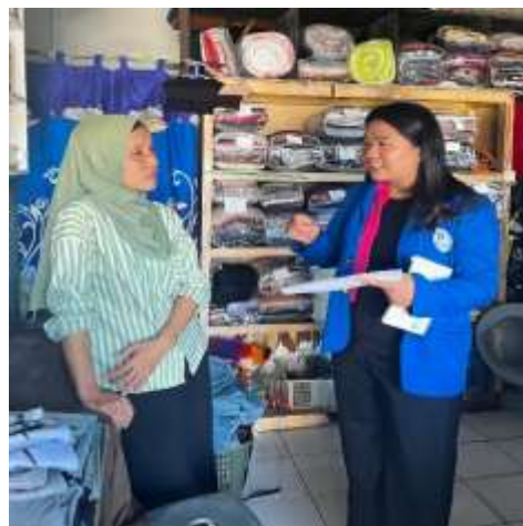
UMKM Sinar laundry